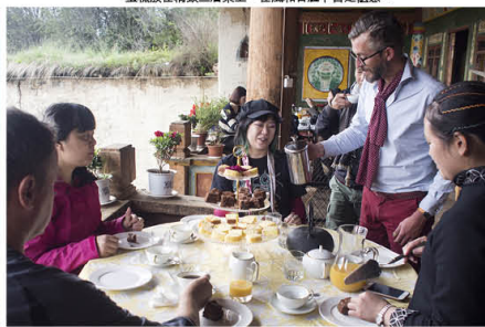
蛋糕放在精緻三層架上，在風和日麗下自是愜意。