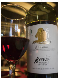
來自雲南的紅酒，原來也不錯。