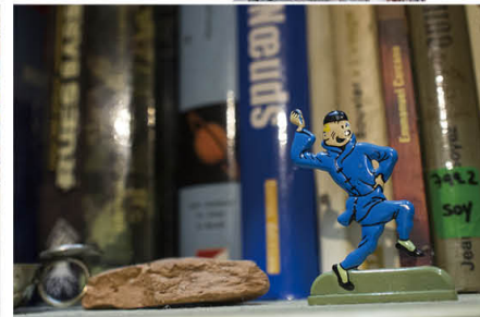
漫畫主角汀汀跟Constantin一樣，都不愛隨波逐流熱愛冒險。

幾年前的馬幫旅程，主要以移動帳篷為主，人隨馬隊移動，在合適之地紮營過夜。隨著二人成家立室並成功造人之後，這位法蘭西後男早已意識到需要置一個安樂窩，兩年前在雲南藏區尋尋覓覓，欲找一個既能方便馬幫旅行活動，又能享受雲南自然風光，亦能給自己妻兒好好過日子的地方，最後敲定在仁安山谷。