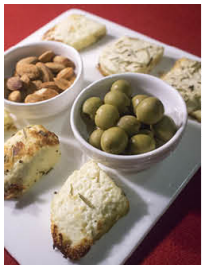
香格里拉之夜，吃著藏芝士和洋蔥，實在難忘。